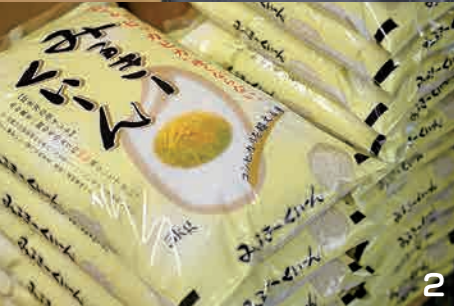
1) 米一筋で優しい笑顔あふれる堀野社長 2) 100%自家生産、自慢の「みるきーくん」 3) 仕事が忙しくても顔を見ると、なぜか癒やされる愛犬