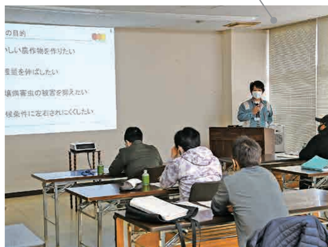
5月の講座では、土づくりの重要性とパセリの病害虫について学ぶ。毎月、実習とともに座学も行われる。