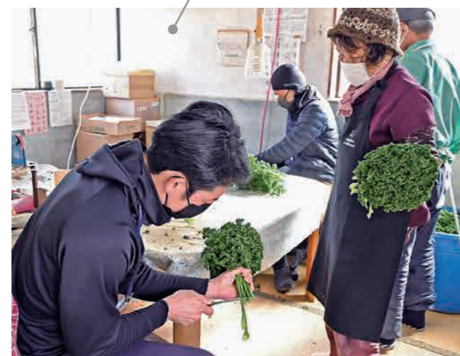
出荷するための荷造り調制作業を学習。農家の助言のもとに、束ね方など難しいところを重点的に学んでいく。