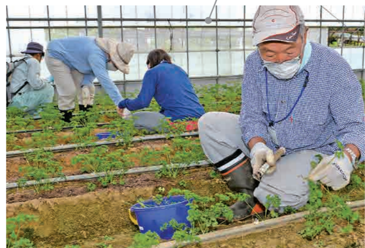
ベテラン農家の指導のもと「間引き作業」を実習。どの株を残すか見極めながら進める。