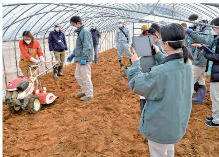
土壌消毒の実習では、受講生みんなが協力して作業を進める。同時に管理機などの操作も体験する。