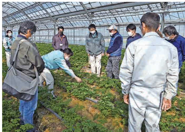
受講生や卒業生のほ場をみんなで見学し、生育状況の確認や管理方法などの説明を受ける。