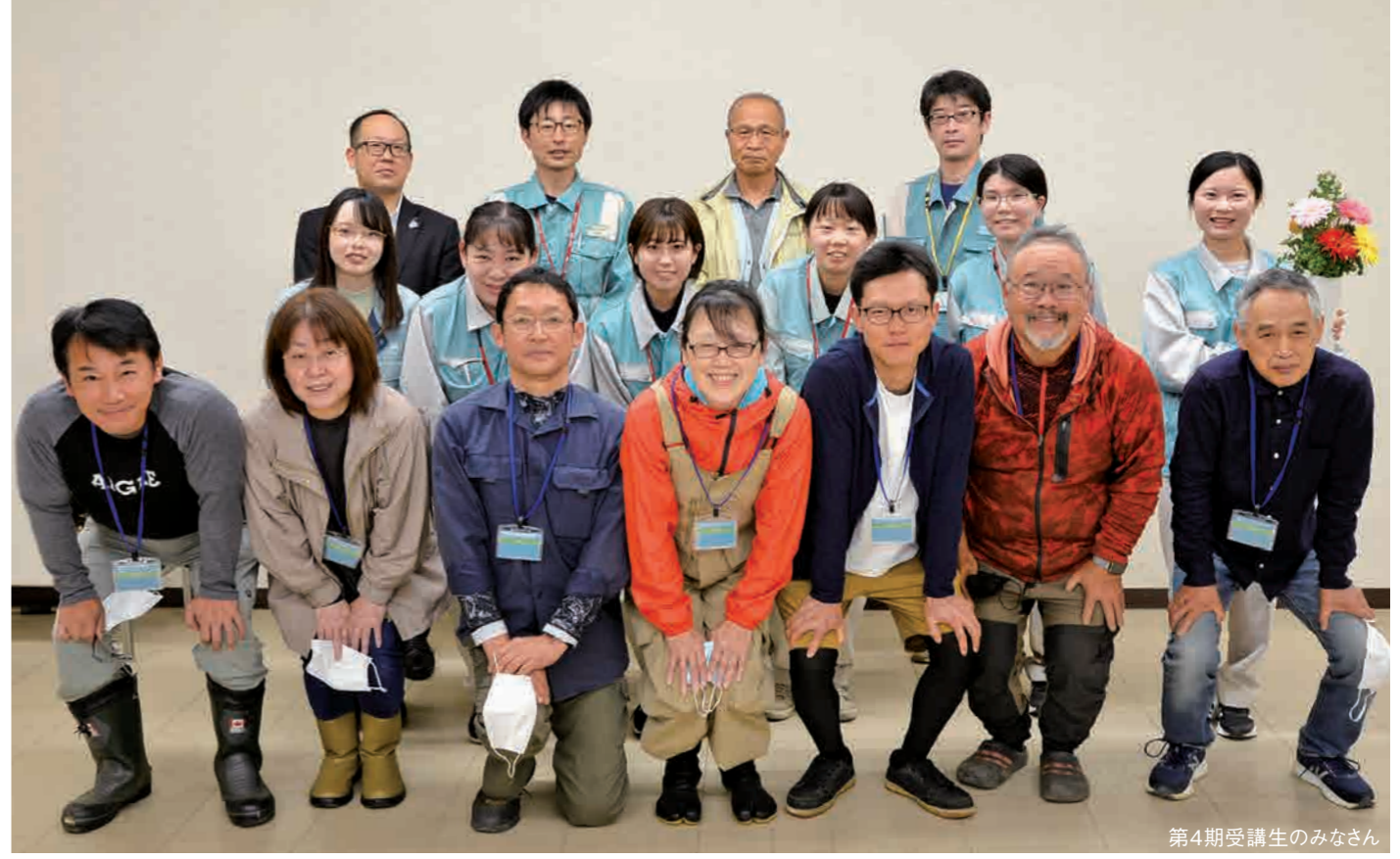
第4期受講生のみなさん

浜名湖東岸を中心に盛んに栽培が行われてきたパセリ。独自の品種で全国屈指の産地を形成してきましたが、近年、生産者数、生産面積ともに減少傾向にありました。 しかし、パセリは軽量で小規模な農地からでも始められることから、定年帰農者や女性も新たな担い手に成り得ると、令和元年、パセリ部会、JA、行政などが結集し「パセリの楽園プロジェクト」を立ち上げました。今号は、6年の歳月を積み重ね、新たに14の方が新規就農した同プロジェクトについてご紹介します。