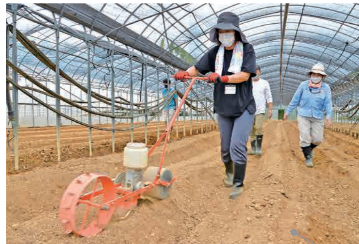
播種機の使用方の説明を受けてから、実習は場で操作実習を行う。まっすぐに動かすことが作業のポイント。