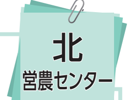
主任 技術指導 木下 和也 セルリー・メロン・えんどう グリーンリーフ その他レタス・プチヴェール