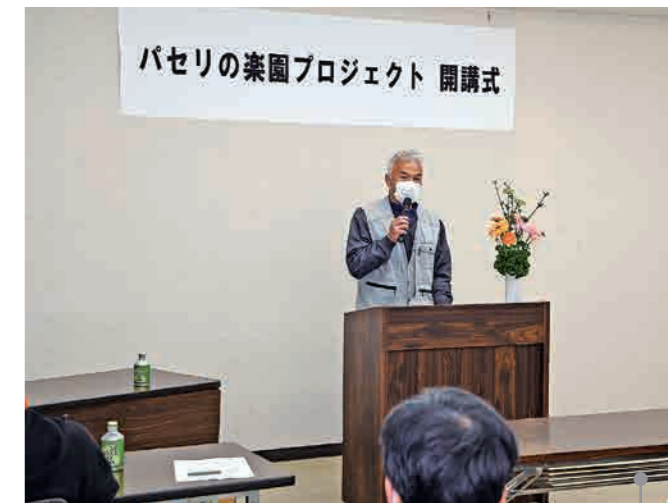
毎年、開講式では、歴代の部会長から受講生へ、期待と応援のメッセージが贈られる。