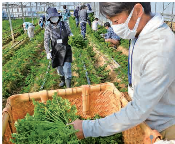
農家や営農アドバイザーの指導のもと、収穫方法を学んで、いざ実践。どの葉を収穫するか見極めるのが重要。