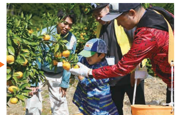
※令和5年度 収穫体験 風景

昨年のおぐり体験隊はミカンを収穫しましたが、今年のおぐり体験隊は、浜松市浜北地区で、トウモロコシとミニトマトの収穫をします。生命の源である農業を体験することで、毎日食べている農産物がどのように生産されているのか知ってもらえることができるプログラムを組みました。農業の魅力や農作物が手間ひまかけて育てられていることを学んでほしいと思います。一緒にがんばりましょう!!