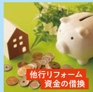
他行リフォーム 資金の借換