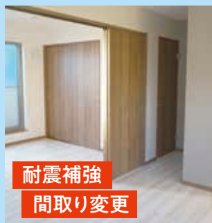
耐震補強 間取り変更