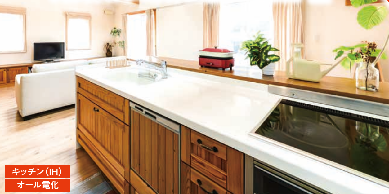
キッチン(IH) オール電化