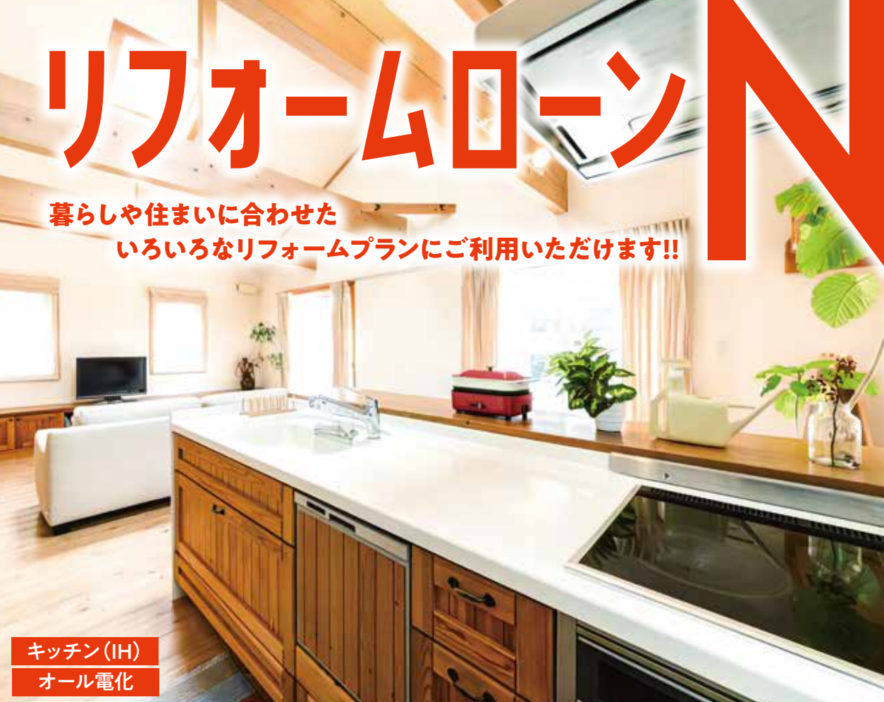
キッチン(IH) オール電化