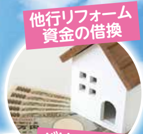
他行リフォーム 資金の借換