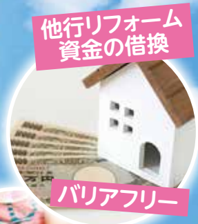
他行リフォーム 資金の借換