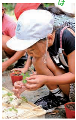
割り箸を使って苗付けをする児童