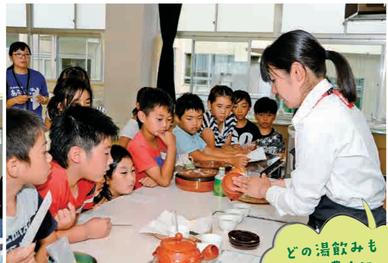
お茶の入れ方を実演する職員

7月10日、鹿玉小学校でお茶の入れ方教室を開きました。児童は湯飲みにお湯を入れ、適温に冷ましてから急須へ。お茶の成分がお湯に溶け出すのを、茶摘み歌を歌って待ちました。交代でお茶を回し注ぎし、最後の一滴までうま味成分をしぼり出すと、みんなでおいしく飲みました。