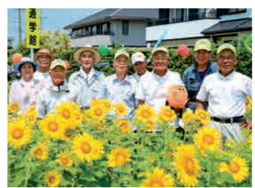
ヒマワリ畑の通路を作り飾り付けを行なった小松報徳社の皆さん

浜北区小松にある小松報徳社と浜名支店は合同で7月3日、「ひまわり鑑賞会」を開き、地元の幼稚園児や小学生、福祉施設の利用者ら約700人を招待しました。約10aの畑に一万本のヒマワリが一面に咲き誇る景色に、子どもたちは「お花、お顔より大きい」「黄色がきれい！」と大はしゃぎでした。