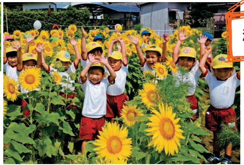
満開のヒマワリに、ばんざーい！！