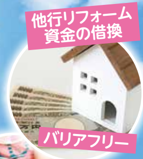
他行リフォーム 資金の借換